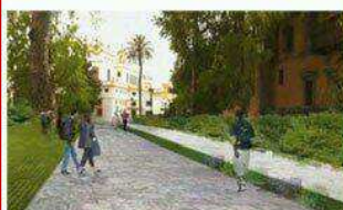
Corazón Parque Central María Luisa