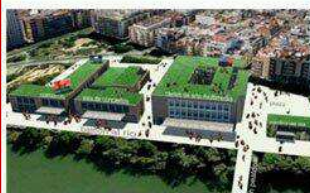
Centro Fábrica de Arte Elcano