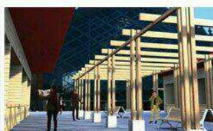
Reurbanización de Plaza Armas