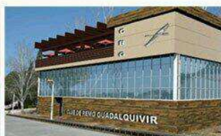
Remodelación Club de Remo Guadalquivir