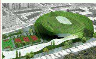
Pista de esquí