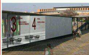
Proyecto "Welcome Sevilla"