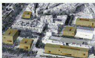
Nuevo Distrito Judicial

la "prometitis" de Zoido · www.alaizquierda.com