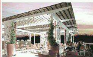
Reurbanización del Paseo Juan Carlos I