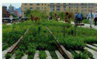
Reurbanización del Canal de la Ranilla