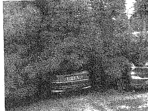
Coches semiseñalados bajo las ramas de uno de los árboles.