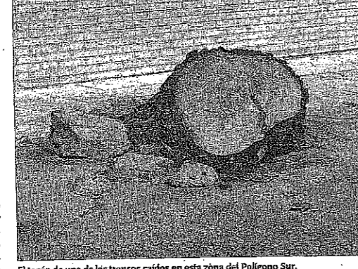
El tocón de uno de los troncos caídos en esta zona del Polígono Sur.