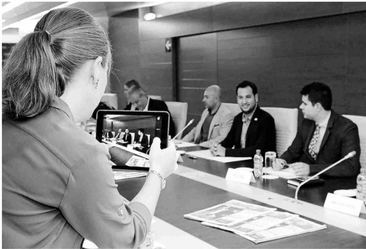
El encuentro se siguió en directo en las redes sociales. / José Luis Montero