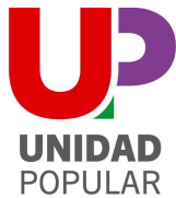
Alberto Garzón Espinosa

Con el 96% de los votos, consiguió el apoyo de 23.712 sufragios frente a 305 de su inmediato seguidor. El 28 de octubre resultó proclamado candidato a la Presidencia del Gobierno.